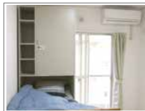
ベッド付きのお部屋もあります