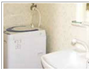
部屋に洗濯機と シャワー付洗面台を完備