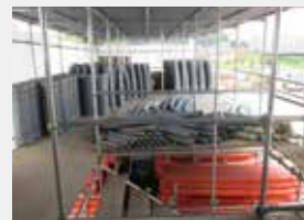
都筑機材所 (資材置き場)

資材置き場は3300mという広大なスペースの中にトラック、 重機合わせて50台と工事に必要な資材がそろっています。 作業員については、出勤時は寮から社用車または自転車で資材 置き場に行っていただき、そこから各グループごとに作業車に乗り、 現場に移動していただきます。