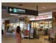
改札口前のスーパー