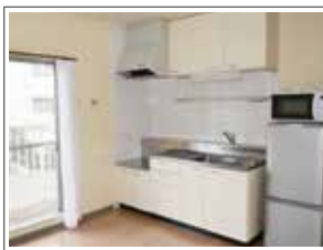
必要なものがそろった 明るいキッチン