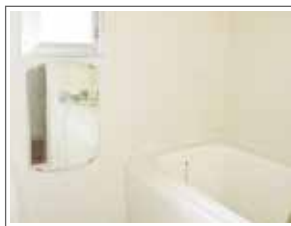
自然光が差し込む お風呂でリラックス